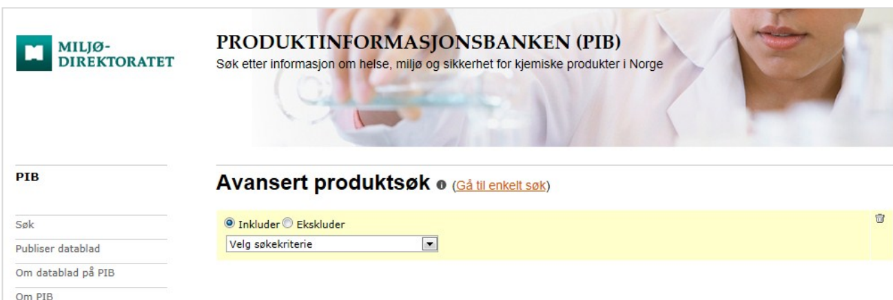
Det avanserte søket på www.pib.no