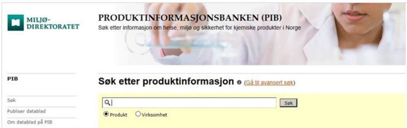
Søkefeltet på www.pib.no

Under ser du skjermbilder av både det "enkle" og det "avanserte" søket.